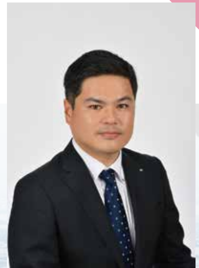
2018年度 一般社団法人 西宮青年会議所 第68代 理事長